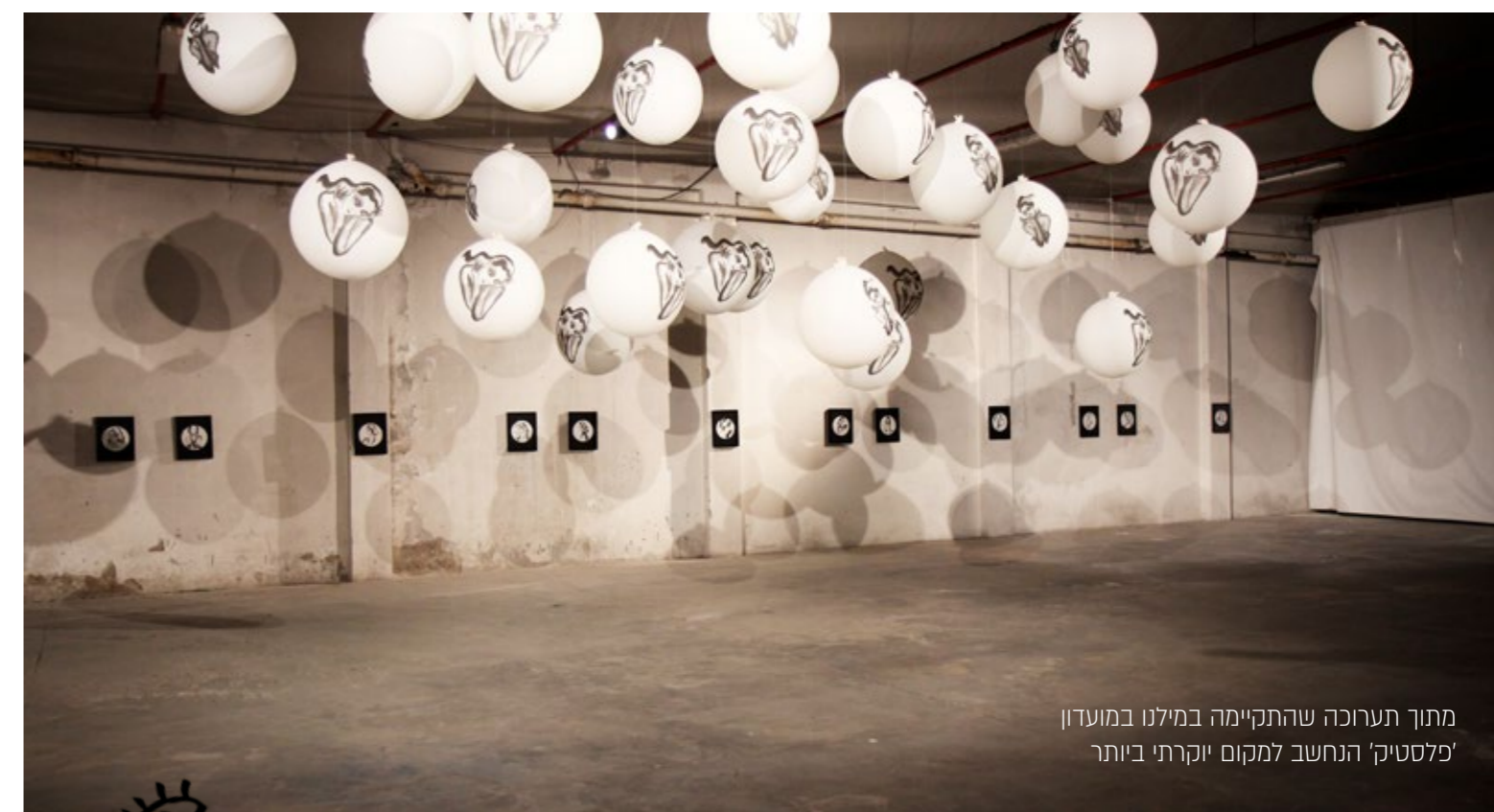
מתוך תערוכה שהתקיימה במילנו במועדון 'פלסטיק' הנחשב למקום יוקרתי ביותר