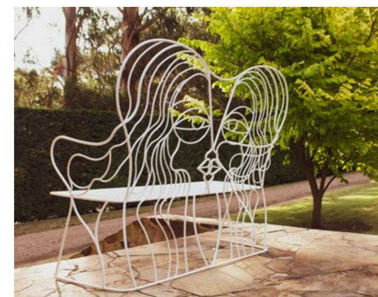
רישומים ופיגורה שנעשו עבור חברת מיסוני