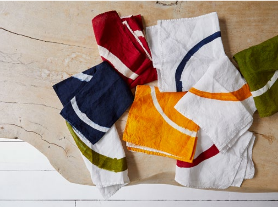
מפיות, כחלק מהעיצוב הכולל שנעשה עבור רשת מסעדות אוטולונגי בלונדון