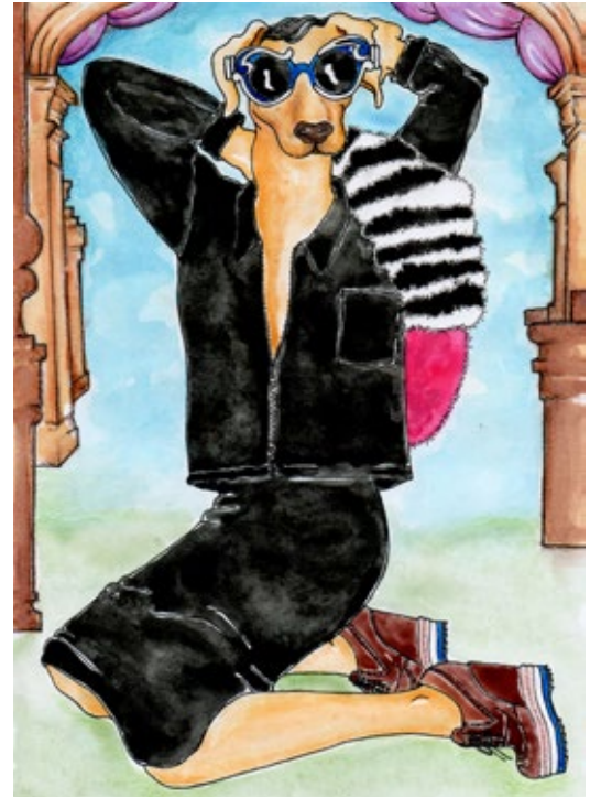
פיגורה שנעשתה עבור חברת פראדה