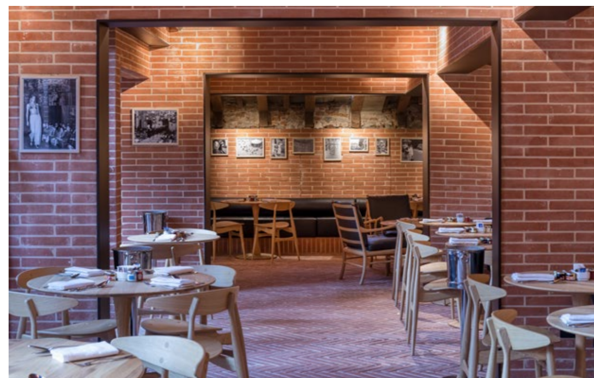
באזור הבילוי של המלון, שבעיצובו בולט השימוש בטרה קוטה, הושארה בחיבור הגג אל הקירות, רצועה חשופה המגלה את חיבורי הגג העתיקים