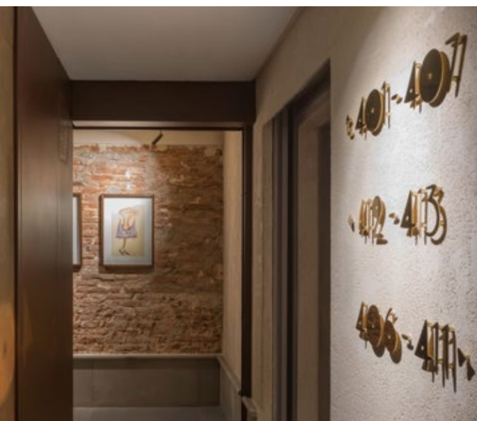
מספרי החדרים הם חלק מגופנים ייחודיים שפותחו כחלק ממיתוג המלון

החללים בהם מודגשת הצבעוניות השלטת ברחבי פירנצה, הם חדרי הרחצה. המראות המקושטות מקבלות גוון כרום מבריק שמתחבר לבסיסי הכלים הסינטיים, שחור לבן וכתום, או שחור לבן וירוק עמוק, בגוונים המשולבים באריחי השיש המחפים את הקירות, גוונים שבהם נתקל כל מי שנמצא בעיר יותר מחמש דקות. אמנות שמתבטאת בתמונות אורגינליות שנאצרו