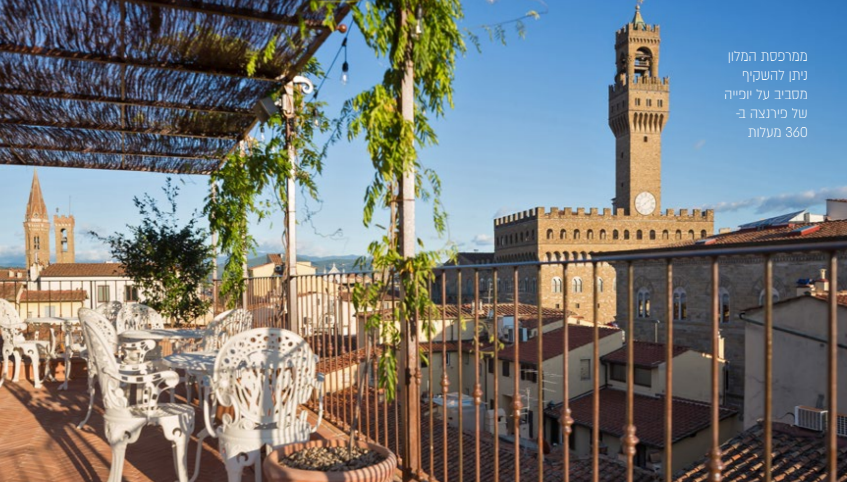
ממרפסת המלון ניתן להשקיף מסביב על יפייה של פירנצה ב- 360 מעלות