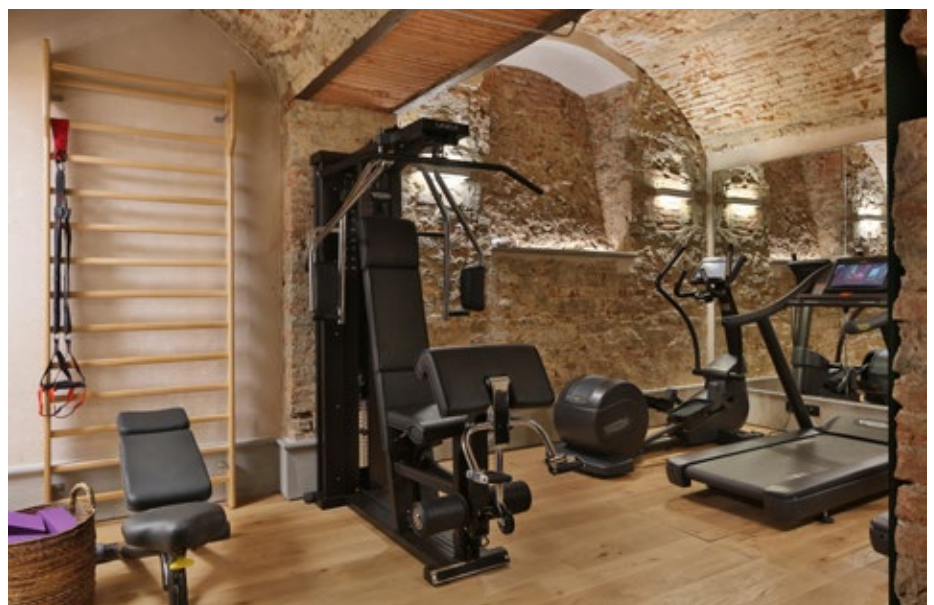
המרתף ששימש בעבר כמחסן הוסב לחדר כושר מאובזר