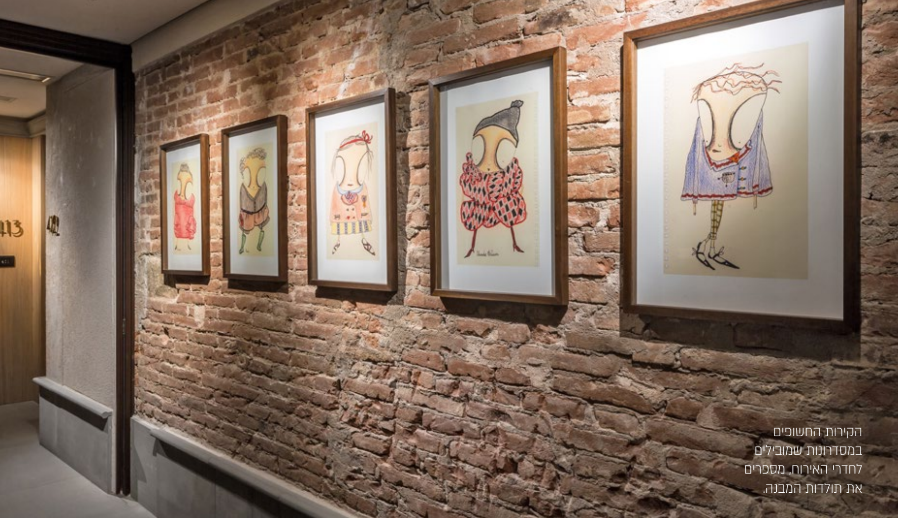
הקירות החשופים במסדרונות שמוכילים לחדרי האירוח, מספרים את תולדות המבנה.

החיבור, מספרי החדרים מתכתבים עם ידיות פתיחת הדלתות הממוקמות במרכז הדלת. פרט המשלים את מראה המסדרונות והמדרגות המקשרות בין הקומות, הוא גופי תאורה עשויים קורטן, חומר עכשווי עם ניחוח עתיק, שעוצבו על ידי מיטליס. ■ הפריקט נוהל על ידי אלעד כהן.