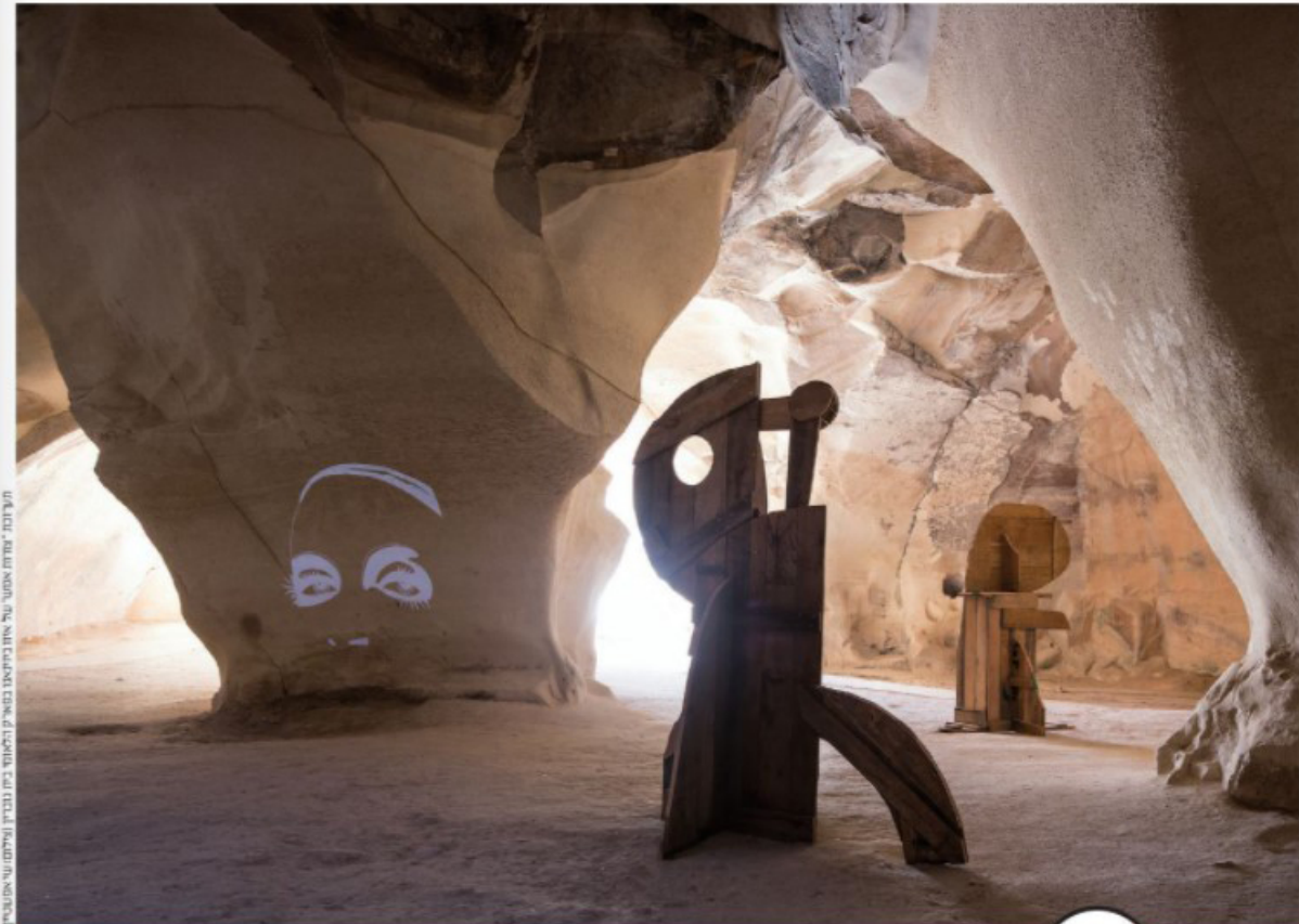
תערכת 'מחמד אשטרי' את מיטלים בארץ ובלונדון. בת עבודתו

שחלקם אף זכו בפרסים נחשבים. משרדו עוסק באדריכלות, עיצוב פנים, עיצוב רהיטים ואובייקטים ומיתוג. ומספק חווית עיצוב סללת מרמת חכנון הבניין ועד לעיצוב הסכום. מחצית מהפרויקטים של המשרד מבוצעים ביירופה ובארה"ב ומחציתם בירץ. מסמיטלים עצמו מחלק את חייו בין לונדון לתל-אביב 'אחרי השנה האחרונה. בה נולית מחמד את הבית. ששינה את תפקידו. הבתי מחמד את ההבדל בין עיקר לטפל". אומר מיטלים. "עכשווי אני מתמודד עם העורך לתח