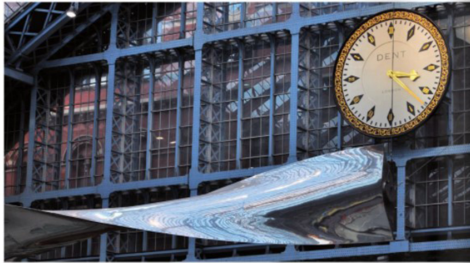
סל בעיצוב רח ארד בחנת הרכבת סט מוקיאם לנדון

בטיו לשיני שכלט עברנו. העולם והמצאות אותם אני חי וחווה הם ההשראה שלי. הטקסטים בחלל בין אדם לאובייקט ובין אדם לאדם הם המיד נקודת הניק. אני אוהב להגדיר את עצמי ככמאי ולתת משמעות לנראה וללא נראה. אני אוהב לחנוגות הטקסטים הבמיליים של החיים. לחשוב איך הם יכולים להראות. לתת להם רקע שמרומם את החיים ולהרחיק מטרנדים. ממד הזמן הוא חמיד אתגר גדול בעיני. יש חללים משלמים שהם מחוץ לממד