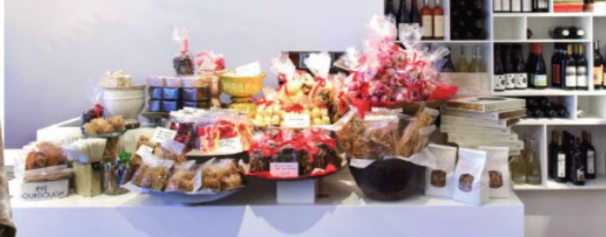
תוצרת: חממת אונד ברונת Ottolenghi בלונדון מחמלה: חפיל עשוי לנד בעיצוב יעל פנקוס

כמו לשחף פעולה עם יוצר אחר, בייעל פנקוס נתקלתי לפני הרבה שנים מטעוד הייתה עלמת אדריכלות. מהטובות שהכרתי. מטעבדתי על מלון Calimela בפירנצה וחיפשוני יוצרים מקומיים נתקלתי באינסטרטם בסטודיו שנקרא slow lab firenze felt. חיפשוני מעבדים מקומיים לאביזרים השונים שהייתי צריך למלון. ולהפתעתי גילית