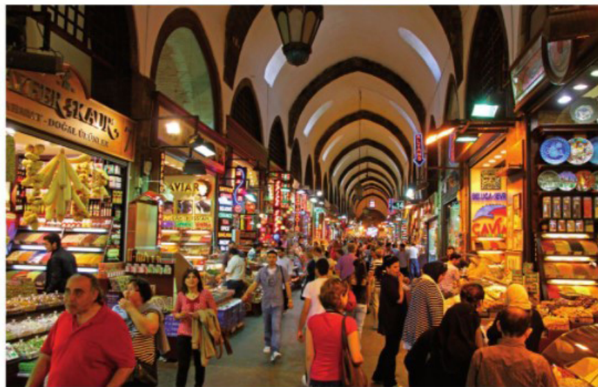
המלון באיסטנבול

שאני יוצר הוא מעין דיוקן של האישים שאני בונה עבורם, אבל במסב יד. עם זאת בהסתכלות מסביב. בחקופה שבה אנחנו נמצאים. אין לי ספק שעולם העיצוב הולך להשתנות. כיוון שהצרכים והדרישות מהבית כל כך השתנו. עוד מוקדם לדעת אבל אני כבר מרגיש בפרייקטים בהם אני עוסק שהשיח משתנה. לדעתי הדרישה לחומרים אמיתיים תגדל. הרעב לתוס אנשי שכל העולם נמצא בו יביא סוג שונה של חללים ציבוריים וסוג אחר של חומרים ומכון גם מודעות לבניה ירוקה. —