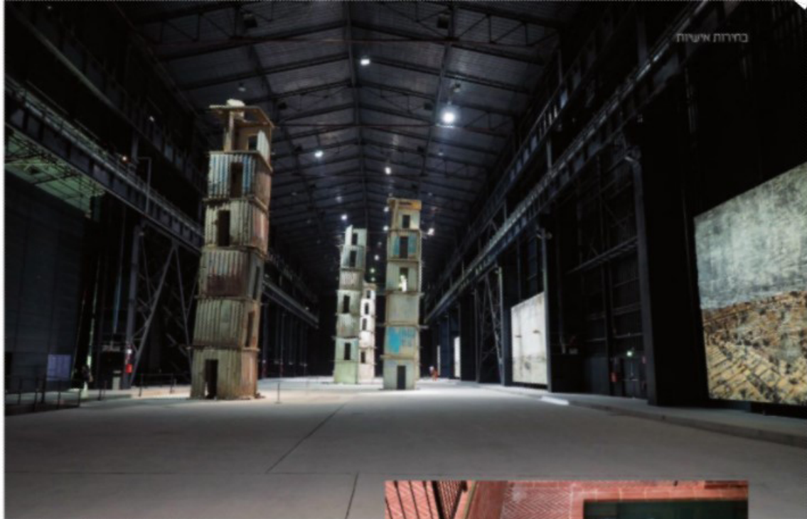
מסךן החרים הקומים, סוף Calvesa כעיצוב מיטלים במרונה (גילום אילרן סוק) Dakti Pirell Hangar Blooms (פילרן אילרן סוק)

ובגבולותיו. תחום שמרתק אותי. בקצוות הדמיון נמצא התמסין שאני מחפש. ובנוסף האמונה בדמיון משותף של הימנות - מסגן שכולט כבני אדם שותפים לו. אני לא בטוח שאני רק לוקח השראה. גם פעולת הקריאה עצמה משחררת לי את הדמיון. מסאני תקות או חסר אונים מול פרויקט אני בורת לספר טוב והדמיון משתחרר. דבר שהמדריה הוויזואלית לא עושה. יש להבדיל דמיונים ויזואליים. שמגבילים את הדמיון. מגילים שיש בקן סוג של פתיחות שמשתחררת.